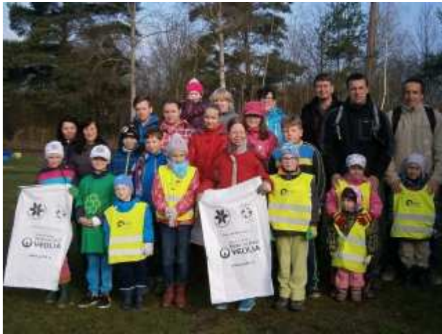
Foto z úklidu shlédněte zde: Foto/Uklidme svet/uklidme Cesko 2017/

Ve čtvrtek 6. dubna byla dokončena rekonstrukce obecního bytu v č.p. 27. Po ukončení nájmu se obec rozhodla byt modernizovat. Cena, která zahrnovala zateplení odvodových stěn, výměnu podlahové krytiny, opravu omítek, renovaci vytápění a pořízení nové kuchyňské linky včetně spotřebičů činila 327.768,-Kč. Ruku k dílu přiložili i zaměstnanci obce na VPP a osoby OZP, kteří zde odpracovali 174 hodin. Snímky z rekonstrukce naleznete zde: Foto/Rek. bytu 2017/